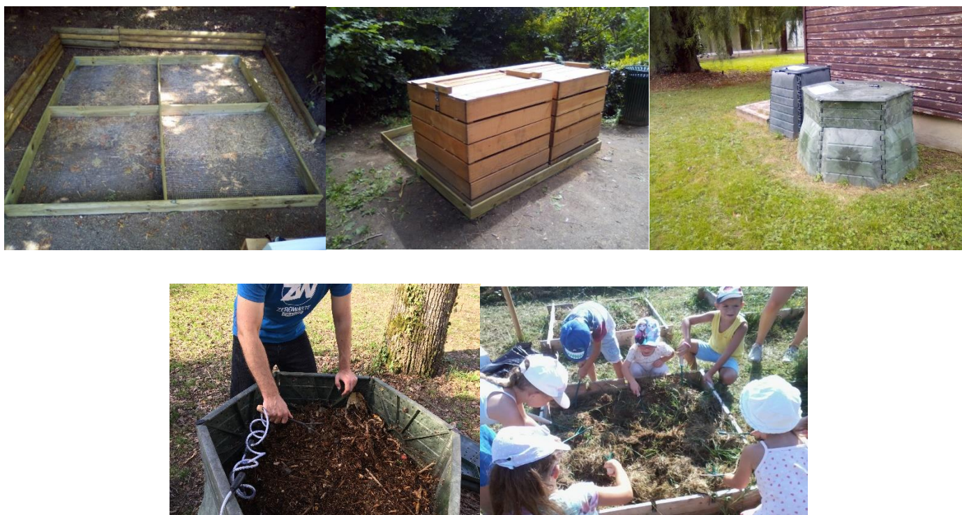
Figure 1: En haut, de gauche à droite: dispositif anti-rongeur et carrés-potager pour Compostou, Compostou installé en parc public (Jardin des Prébendes à Tours), site de compostage universitaire accompagné par l'association. En bas, de gauche à droite : visite de contrôle sur un composteur accompagné, animation compostage avec des enfants de centre de loisir.

Nous avons spécialement conçu et breveté le Compostou , un composteur partagé innovant qui est proposé selon un service de location-maintenance-accompagnement. Zéro Déchet Touraine peut aussi accompagner des sites de compostage partagés déjà existants en bas d'immeuble, en établissement scolaire ou en entreprise, ou y installer des composteurs de votre choix. Nous pouvons également fournir à la demande, diverses prestations et matériels complémentaires autour du compostage (outils, dispositifs anti-rongeurs, cadenas...). Nos Maîtres-composteurs et Guides-composteurs connaissent parfaitement les bonnes pratiques de compostage et sauront vous orienter vers la technique et le matériel les plus appropriés à vos besoins.