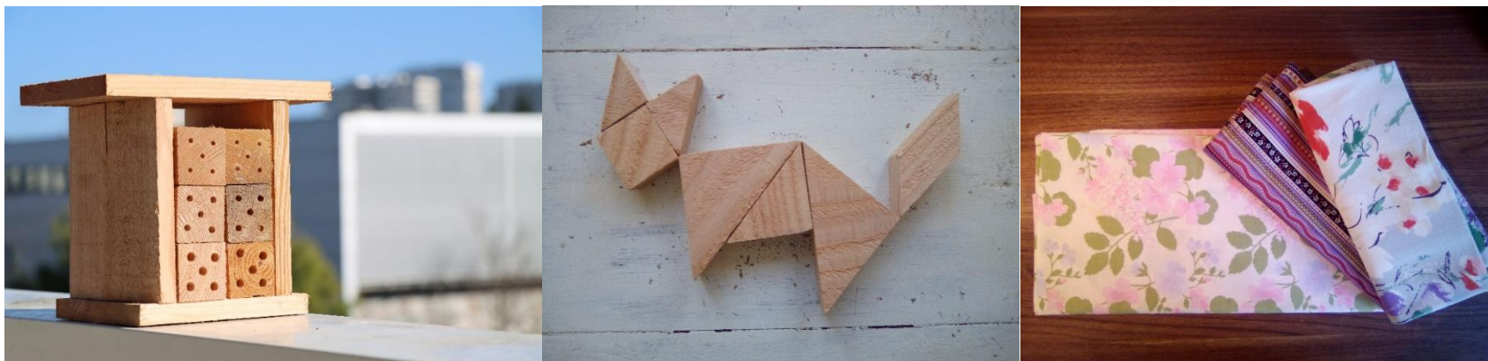
Figure 3: Nichoir à abeilles sauvages "TORII", tangram, furoshikis.

Fidèle aux principes qu'elle promeut, Zéro Déchet Touraine valorise ses sous-produits d'activité à travers la fabrication d'objets à partir de chutes de planches et de lambourdes. Les éléments sont découpés et percés par l'ESAT Les Ormeaux, à Montlouis-sur-Loire, puis assemblés à la main par nos soins. Chaque pièce est donc unique.