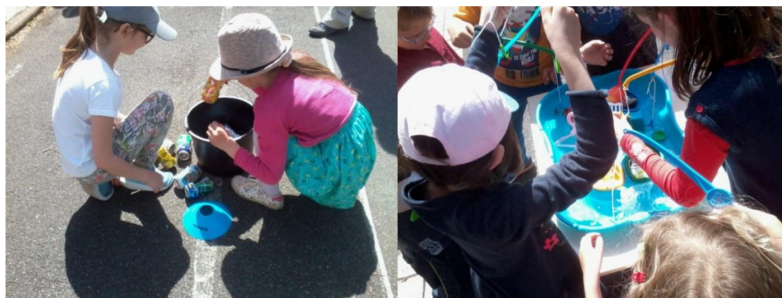
Figure 2: Elèves jouant à la "course aux déchets" et à la "pêche aux vilains déchets"