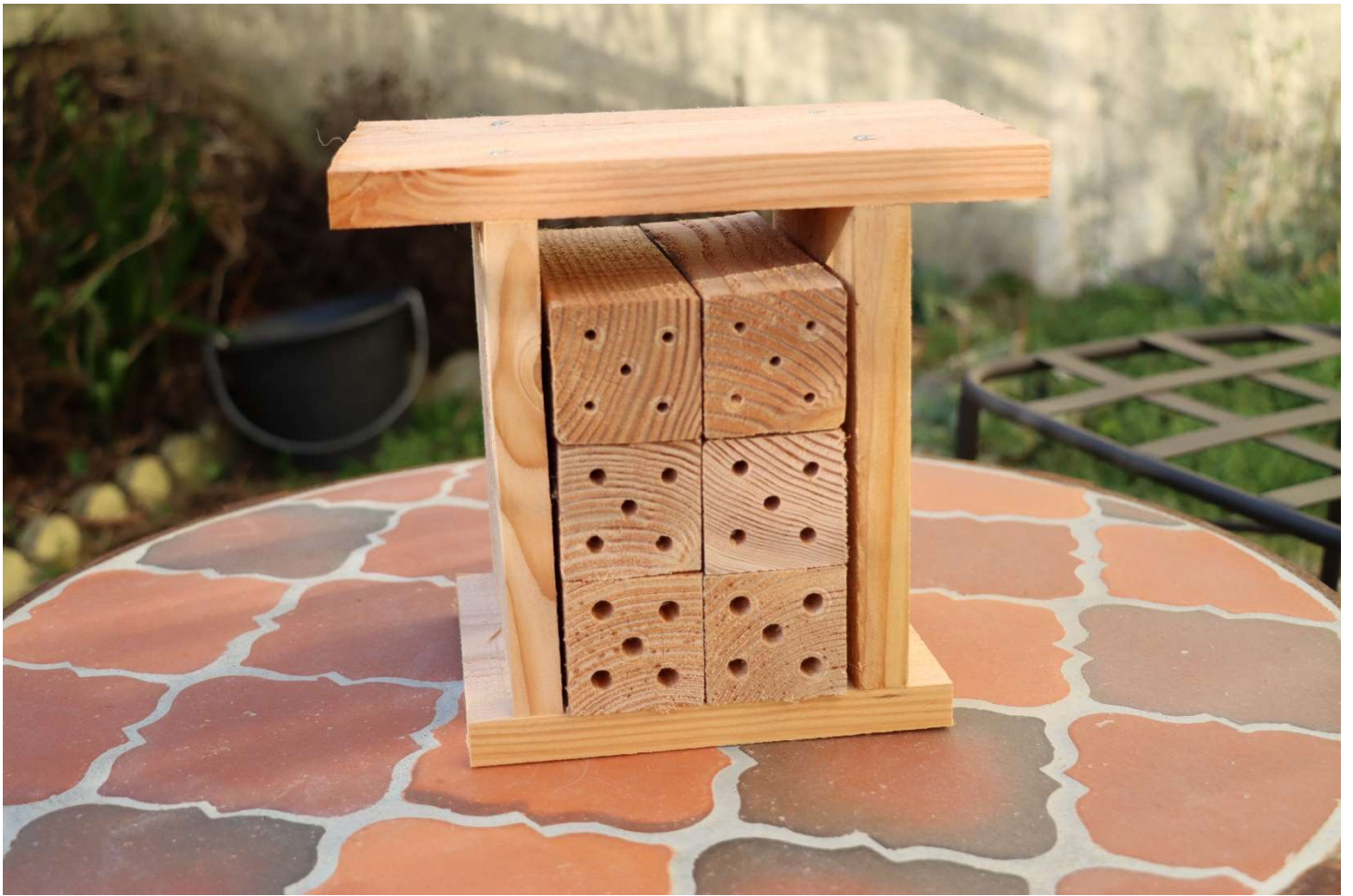
Nichoïr TORII pour abeilles sauvages