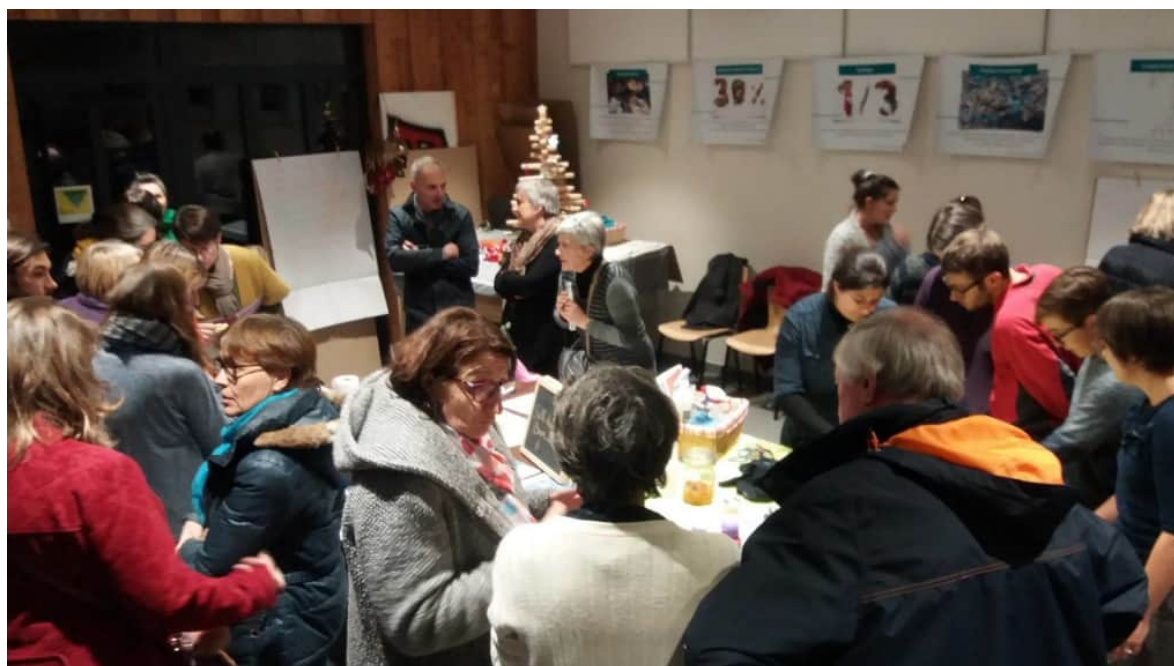
Figure 4: Les participants au premier Z'Apéro de "Sainte-Cath"

On imagine créer un événement par mois peut être, dans un village différent à chaque fois. À noter que le Maire de Sainte Catherine s'est dit favorable à l'utilisation de la salle « Colibri », tous les 2 mois, pour organiser des événements zd. Affaire à suivre !