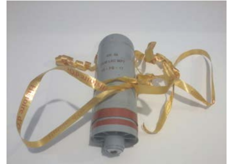
Figure 5: l'étui à lunettes/lacrymo, une idée originale et ZD pour les fêtes