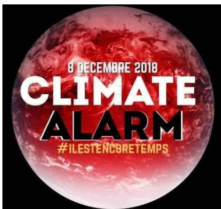
Figure 1: Le samedi 8/12/2018, nous sommes allés à Tours pour sonner l'alarme climatique

Zéro Déchet Touraine a participé officiellement à sa première marche pour le climat, le samedi 8 décembre 2018. Objectif : envoyer un message fort à la population et à nos décideurs au sujet de la contribution du secteur de la gestion des déchets au changement climatique !