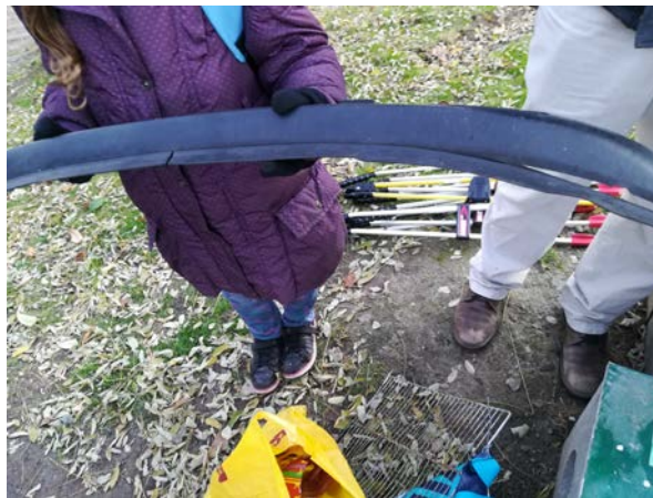
Figure 7: un "truc en plastique noir"