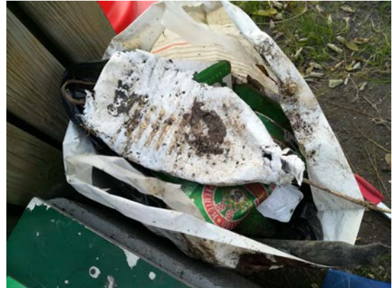
Figure 6: déchets en plastique ramassés sur l'île Simon

La sortie sur l'île Simon a été un succès ! Ci-joint quelques photos pour montrer la collecte. Nous étions huit, dont deux enfants. Nous avons notamment ramassé de nombreux papiers de bonbons, des emballages de barres chocolatées et des bouchons en plastique à gogo, qu'une des ramasseuses pense provenir de bombes de peinture servant à taguer les pieds du pont Napoléon... En bord de Loire, sur la rive sud de l'île, on a ramassé beaucoup de plastique et en particulier des