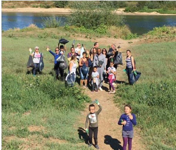
Figure 3: Les membres du collectif Zéro Déchet Amboise réunis pour un nettoyage citoyen