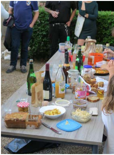
Figure 6: un apéro convivial et zéro déchet, c'est possible!