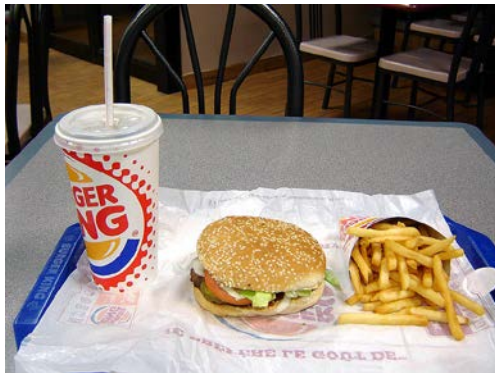
Figure 8: Un plateau-type chez Burger King

Face aux problèmes engendrés par la restauration rapide, il existe plusieurs attitudes possibles et souvent complémentaires. Le « name and shame » consiste par exemple à dénoncer publiquement les agissements honteux d'une marque. C'est la stratégie qu'a récemment suivie Zero Waste France en révélant l'attitude irresponsable des restaurants Mc Donald's 6 en matière de recyclage et de tri à la source des biodéchets. Après un an d'alerte citoyenne sur ce sujet, ZWF a durci le ton en portant plainte le 18 octobre dernier contre deux établissements McDonald's et KFC de Paris 7 . L'appel au boycott est également une arme efficace. Ainsi plus de 26 000 personnes ont répondu à l'appel au boycott de Starbucks Coffee France lancé par un collectif d'associations depuis le site I-boycott.org 8 . Cette campagne constitue une réponse citoyenne à la stratégie d'optimisation fiscale de l'enseigne qui lui permet d'éviter l'imposition sur les bénéfices qu'elle réalise en France. Mais le changement peut et doit aussi venir de l'intérieur et lorsque c'est possible, il est préférable de l'encourager.