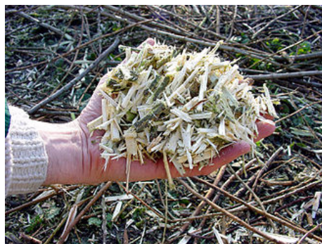
Figure 5: Broyat de branches de saule