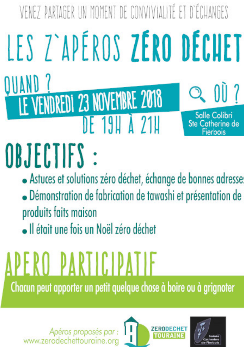
Figure 7: Sainte-Catherine de Fierbois organise son premier Z'apéro le 23 novembre prochain!

Consultez l'agenda de notre site internet pour connaître les horaires et lieux de ces différents événements.